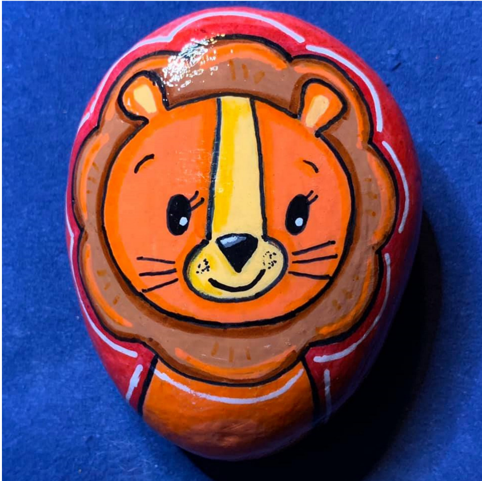
Fertig lackierter Stein.

Vielen Dank an Bärbel Bretzlaff für dieses schöne Tutorial.